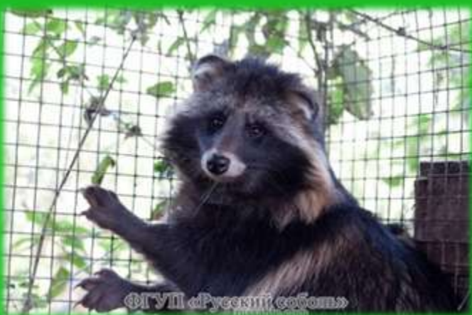
Стандартная енотовидная собака