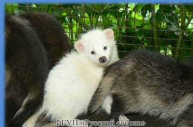
Белая енотовидная собака