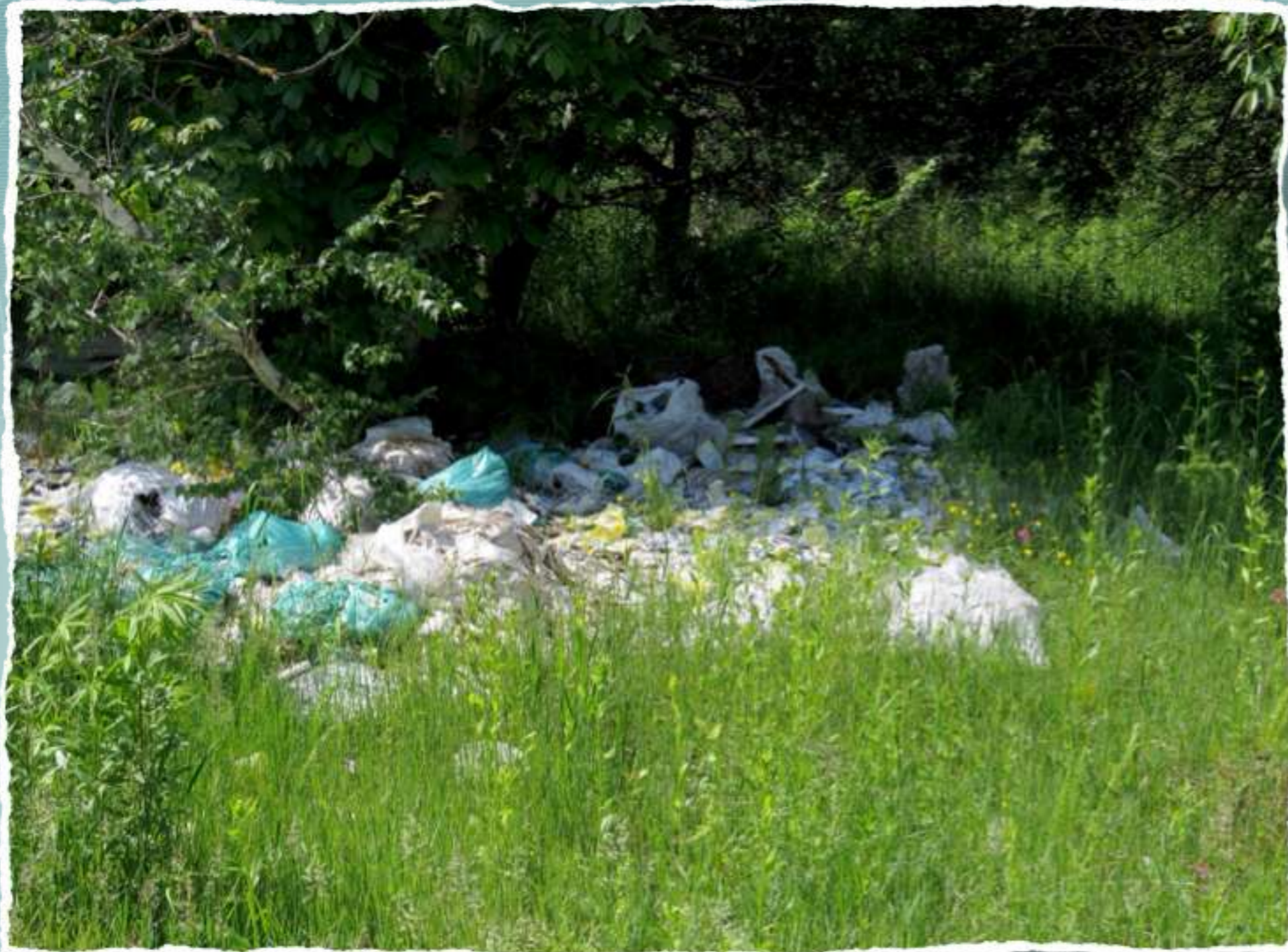
Мусор в лесу